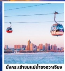
นั่งกระเช้าชมแม่น้ำซงฮวาเจียง