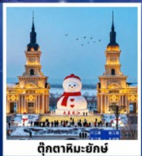
ตึกตาสหิมะยักษ์