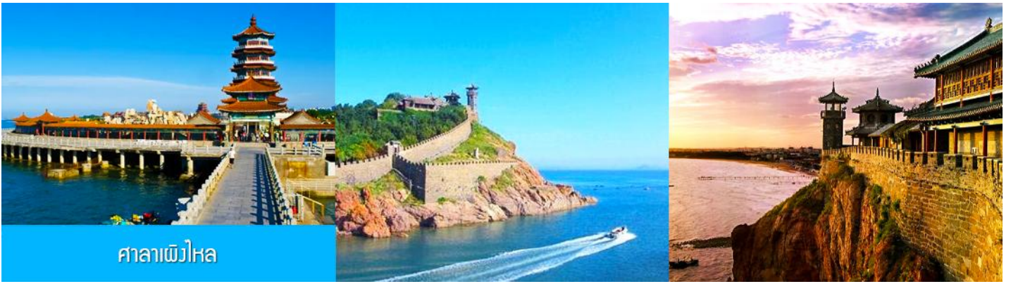
ศาลาเพิงไห่

หลังอาหารนำท่านเดินทางสู่เมืองผิงไห่ ชม ศาลาผิงไห่ ดินแดนแห่งเทพเซียน และเป็นหนึ่งในสี่สถาปัตยกรรมโบราณที่งดงามของจีน ซึ่งตั้งอยู่ริมทะเล ( ชมด้านนอก )