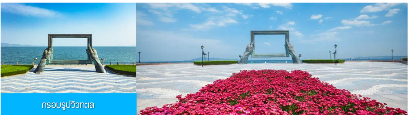
กรอบรูปวิวกทะเล

พักที่ Holiday Inn Express Hotel หรือ ระดับมาตรฐาน 4 ดาว ทั้งหมด