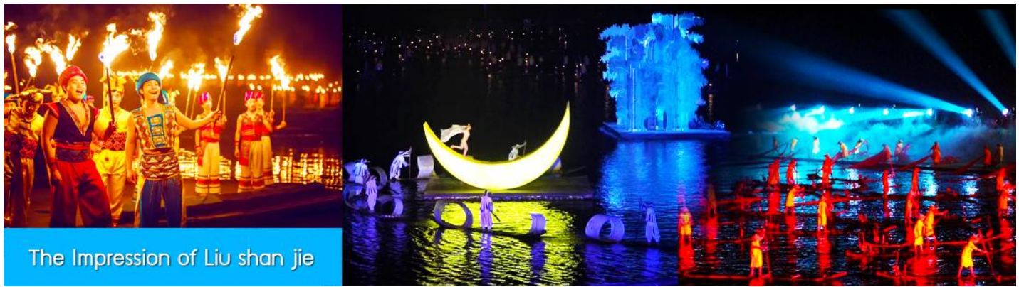
The Impression of Liu shan jie

จากนั้นนำท่านเดินทางเข้าที่พัก หรือท่านสามารถเลือกซื้อโปรแกรมเสริม เป็นบัตรชมการแสดง ชุด The Impression of Liu shan jie หรือที่เรียกกันในหมู่นักท่องเที่ยวไทยว่า โชว์แม่น้ำ เป็นการแสดงบนแม่น้ำหลีเจียงที่ทุ่มทุนสร้างอย่างสุดอลังการ เป็นการแสดงที่น่าดูชมที่สุดในเมืองกุ้ยหลิน การแสดงชุดนี้ใช้แม่น้ำหลีเจียงเป็นเวทีการแสดง โดยมีฉากหลังเป็นภูเขาริมแม่น้ำ ซึ่งให้ความรู้สึกสมจริงเสมือนผู้ชมและนักแสดงอยู่ท่ามกลางธรรมชาติ ใช้ทีมงานนักแสดงหลายร้อยคน และระบบแสง สี เสียง ที่ทันสมัยประกอบในการแสดง