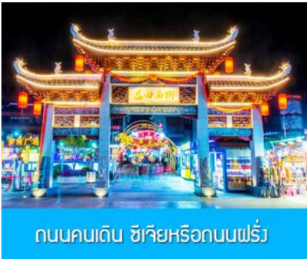
ถนนคนเดิน ซีเจียหรือถนนฝรั่ง