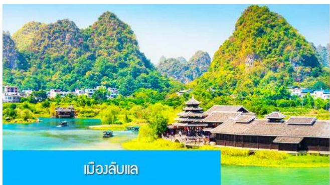
เมืองลับแล