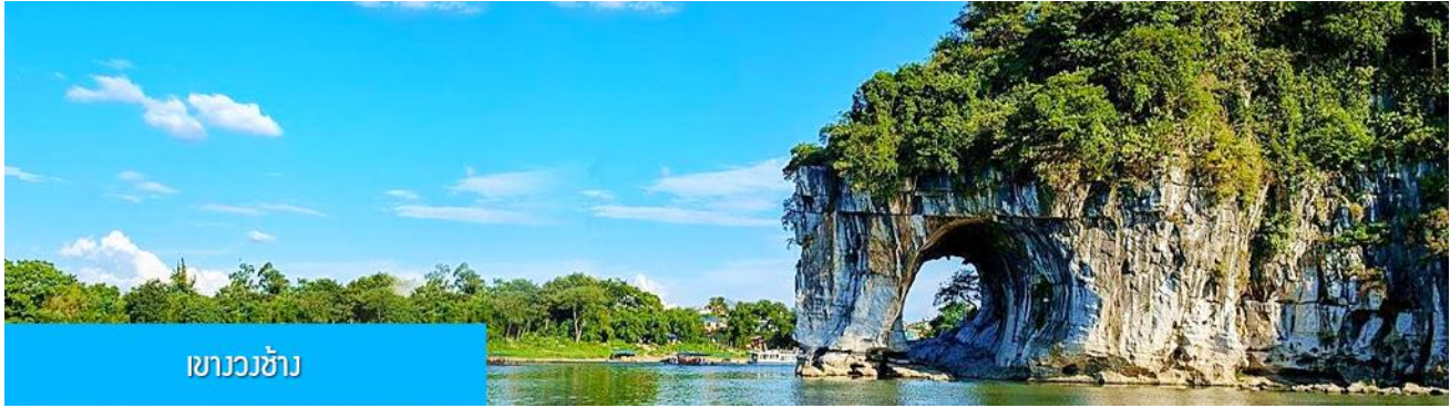
เขาวงช้าง

รับประทานอาหารกลางวัน ณ ภัตตาคาร (มื้อที่ 7)