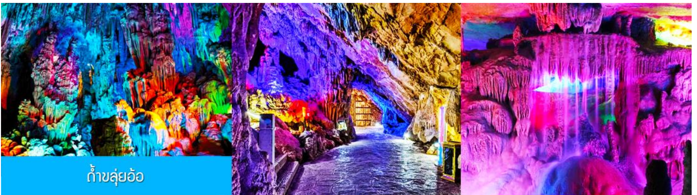
ถ้ำลู่อ้อ

ค่ำ บริหารอาหารค่ำ ณ ภัตตาคาร (มื้อที่ 1) นำท่านเที่ยวชม เจดีย์เงิน เจดีย์ทอง 金銀双塔 แลนด์มาร์คที่โดดเด่นและขึ้นชื่อของเมืองกุ้ยหลิน เจดีย์เงิน เจดีย์ทองเป็นเจดีย์คู่ที่ถูกสร้างขึ้นกลางน้ำ ได้รับการขนานนามว่าเป็นเจดีย์สุริยัน และเจดีย์จันทร์หา โดยเจดีย์สุริยันเป็นเจดีย์ทองสัมฤทธิ์ ที่สูงที่สุดในโลกด้วยความสูงถึง 42 เมตร ทำด้วยทองสัมฤทธิ์กว่า 600 ตัน ส่วนเจดีย์เงินนั้นทำด้วยหินแกรนิตและตกแต่งด้วยแผ่นเซรามิก จุดชมวิวนี่เป็นจุดต้องแวะสำหรับนักท่องเที่ยวที่มาเยือนเมืองกุ้ยหลินทุกคนและได้กลายเป็นจุดเช็คอินยอดนิยมในปัจจุบัน..... พักที่ VIENNA INTER HOTEL ระดับ 4 ดาวท้องถิ่นหรือเทียบเท่าในเมืองกุ้ยหลิน