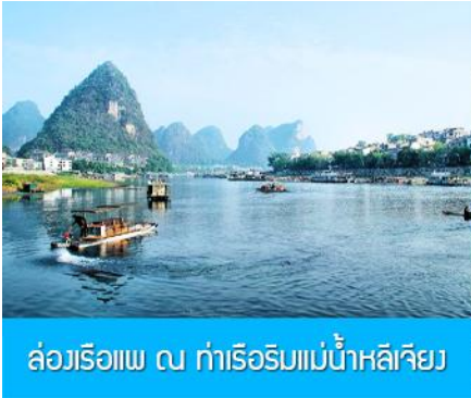
ล่องเรือแพ ณ ท่าเรือริมแม่น้ำหลีเจียง