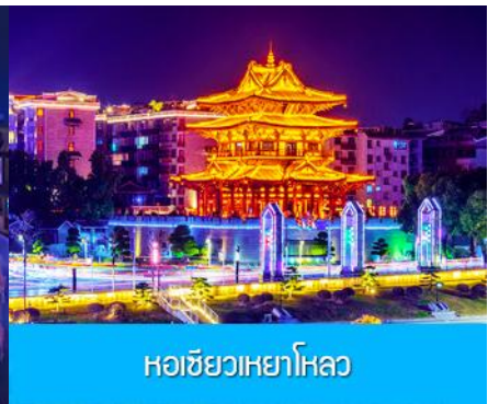
หอชิวเหย้าโหลว