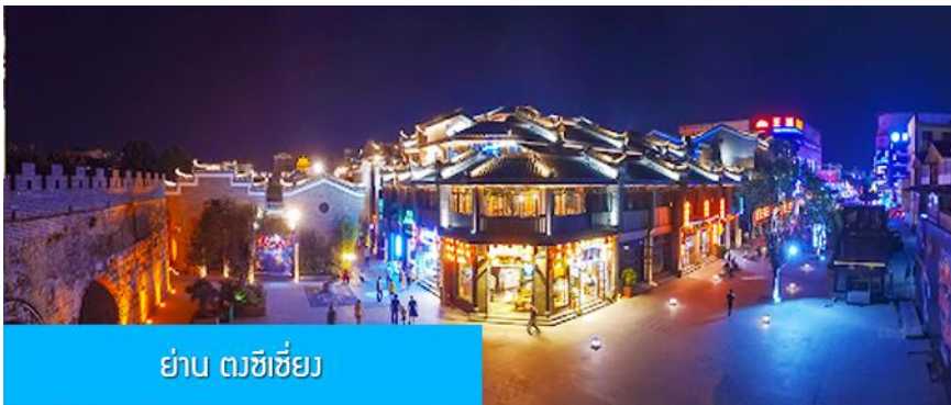
ย่าน ตะขีซี้ย