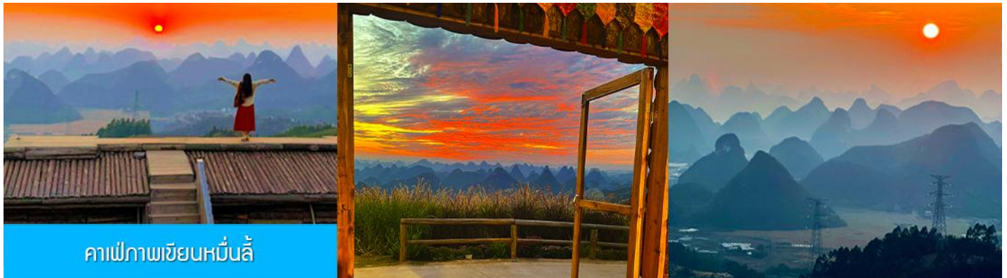
คาเฟ่ภาพเขียนหมื่นลี้

รับประทานอาหารกลางวัน ณ ภัตตาคาร (มื้อที่ 5)