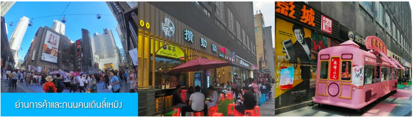
ย่านการค้าและถนนคนเดินลี่หมิง

หลังอาหารนำท่านสู่ ย่านการค้าและถนนคนเดินลี่หมิง 力盟商业步行街 ย่านการค้าทันสมัยที่มีห้างสรรพสินค้าขนาดใหญ่หลายแห่ง ถนนคนเดินที่คึกคักไปด้วยร้านค้าแบรนด์ท้องถิ่น ร้านอาหารพื้นเมือง ร้านสะดวกทานฟาสต์ฟู้ด ให้ความอิสระท่านเดินช้อปปิ้ง ชิมอาหารพื้นเมืองเต็มที่