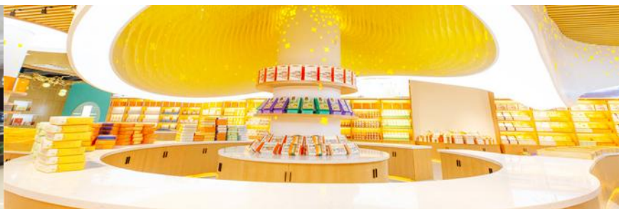
พิพิธภัณฑ์ดอกกุยฮวา

จากนั้นนำท่านเที่ยวชม พิพิธภัณฑ์ดอกกุยฮวา 桂花公社 ดอกกุยฮวาเป็นดอกไม้สีเหลืองที่มีกลิ่นหอม เป็นดอกไม้ประจำเมืองของกุยหลิน จะเบ่งบานในช่วงเดือนมิถุนายน – กรกฎาคมของทุกปี ในช่วงที่ดอกกุยฮวาเบ่งบานในเมืองกุยหลินจะคลุ้งไปด้วยกลิ่นหอมจากดอกกุยฮวา ทั่วเมืองกุยหลินจะเต็มไปด้วยสีเหลืองของดอกกุยฮวา ดอกกุยฮวาสามารถนำมาแปรรูปเป็นอาหารและเครื่องดื่มได้ และได้รับความนิยมจากชาวจีนตอนใต้เป็นอย่างมาก ชมพิพิธภัณฑ์ที่ทันสมัยด้วยระบบจัดแสดงที่ทันสมัย ภายในพิพิธภัณฑ์มีความโอ่อ่า มีการสาธิตและจำหน่ายผลิตภัณฑ์ที่ทำจากดอกกุยฮวา อาทิ ขนมดอกกุยฮวา ชาที่ทำจากดอกกุยฮวา และสินค้าพื้นเมืองอื่น ๆ