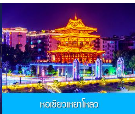
หอชิวเหยาโหลว