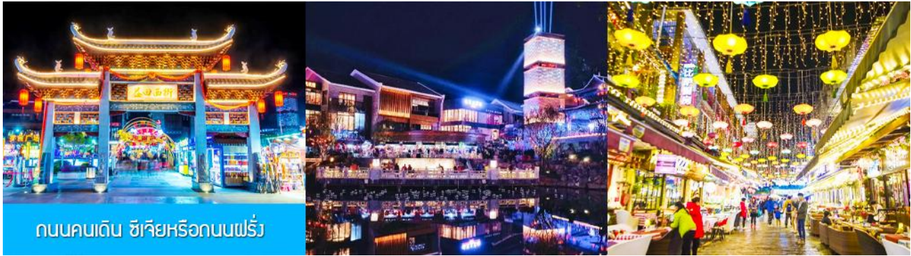
ถนนคนเดิน ซิเจียหรือถนนฝรั่ง