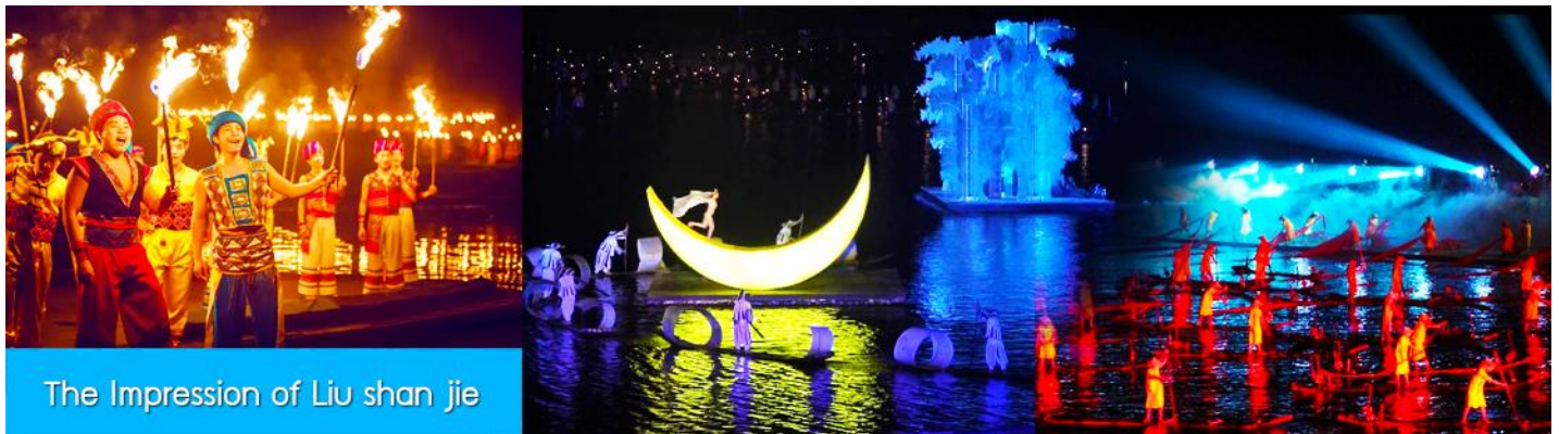
The Impression of Liu shan jie

อิสระอาหารค่ำเพื่อความสะดวกในการเดินเที่ยว และชมอาหารพื้นเมืองตามอัธยาศัย