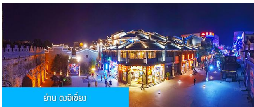
ย่าน ตงซีเซียง

จากนั้นนำท่านเที่ยวชม พิพิธภัณฑ์ดอกกุยฮวา 桂花公社 ดอกกุยฮวาเป็นดอกไม้สีเหลืองที่มีกลิ่นหอม เป็นดอกไม้ประจำเมืองของกุยหลิน จะเบ่งบานในช่วงเดือนมิถุนายน – กรกฎาคมของทุกปี ในช่วงที่ดอกกุยฮวาเบ่งบานในเมืองกุยหลินจะคลุ้งไปด้วยกลิ่นหอมจากดอกกุยฮวา ทั่วเมืองกุยหลินจะเต็มไปด้วยสีเหลืองของดอกกุยฮวา ดอกกุยฮวาสามารถนำมาแปรรูปเป็นอาหารและเครื่องดื่มได้ และได้รับความนิยมจากชาวจีนตอนใต้เป็นอย่างมาก ชมพิพิธภัณฑ์ที่ทันสมัยด้วยระบบจัดแสดงที่ทันสมัย ภายในพิพิธภัณฑ์มีความโอ่อ่า มีการสาธิตและจำหน่ายผลิตภัณฑ์ที่ทำจากดอกกุยฮวา อาทิ ขนมดอกกุยฮวา ชาที่ทำจากดอกกุยฮวา และสินค้าพื้นเมืองอื่น ๆ