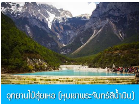
อุทยานไป๋ลุ่ยเหอ (หุบเขาพระจันทร์สีน้ำเงิน)

หมายเหตุ กรณีที่กระเช้าขึ้นภูเขาหิมะมังกรหยกปิดให้บริการ ด้วยเหตุที่สภาพอากาศไม่เอื้ออำนวย หรือเป็นการปิดเพื่อตรวจสอบสภาพและซ่อมแซมประจำปี ทางทัวร์ขอสงวนสิทธิ์ที่จะจัดโปรแกรมขึ้นกระเช้า ที่จุดชมวิวภูเขาหิมะมังกรหยก ณ สถานีกระเช้าหุยนซานผิงแทน