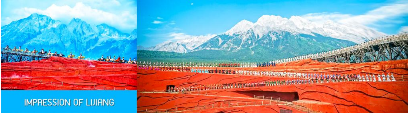
IMPRESSION OF LIJIANG

ชมการแสดง IMPRESSION OF LIJIANG การแสดง ณ เวทีการแสดงกลางแจ้งอันยิ่งใหญ่โดยผู้กำกับชื่อดังของโลก จางอวี๋โหมว ที่ได้ทุ่มเทฝีมือเนรมิตให้ภูเขาหิมะมังกรหยกเป็นฉากหลัง และสร้างเวทีกลางแจ้งและอัฒจันทร์กลางแจ้งเพื่อใช้ในการแสดง โดยใช้ทีมงานนักแสดงกว่า 600 ชีวิต ประกอบด้วยระบบแสง สี เสียง พร้อมการแต่งกายของเครื่องแต่งกายพื้นเมืองของเหล่านักแสดง โดยถ่ายทอดเรื่องราวชีวิตความเป็นอยู่ และชาวเผ่าต่างๆ ของเมืองลี่เจียงผ่านการแสดงในชุดต่าง ๆ