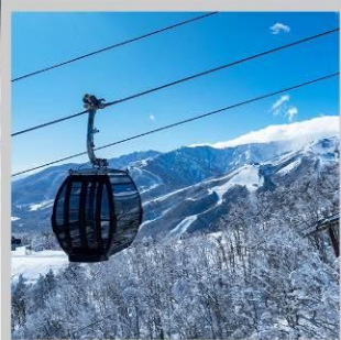
“HAKUBA IWATAKE GONDOLA”