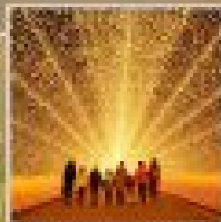
"NAGANO NO SATO"