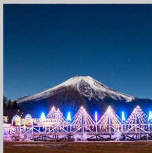
“YAMANAKAKO ILLUMINATION FANTASEUM”