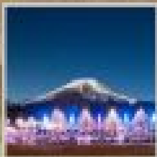
"HAKUBA SKI PARK"

ที่พักโรงแรม 2 คืน ที่พักโรงแรม 4 คืน 3 คืน เที่ยวบินกรุงเทพฯ - ฮกไกโด เที่ยวบินฮกไกโด - กรุงเทพฯ