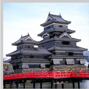
“MATSUMOTO CASTLE PARK”

สัมผัสความงดงามด้านนอก “ปราสาทมัตสึโมโตะ” ที่ตั้งตระหง่านท่ามกลางฉากหลังของเทือกเขาแอลป์ตอนเหนือ เปลี่ยนอิริยาบถ “ส่องเรือชมหุบเขาอะนะเคียว” ชมความงดงามธรรมชาติ ต้นไม้ หน้าผา และสะพานแดงอันโด่งดัง ตื่นตากับการประดับไฟกว่า 5 แสนดวง กับงาน “YAMANAKAKO ILLUMINATION FANTASEUM” ริมทะเลสาบยามานากะ สนุกสนานกับการเล่นหิมะ ในกิจกรรมต่างๆ ณ “FUJITEN SNOW PARK” พร้อมวิวภูเขาไฟฟูจิเป็นฉากหลัง ตระการตา “เทศกาลประดับไฟฤดูหนาว” ในธีมต่างๆหลากหลายโซน จัดแสดงไฟกว่า 2 ล้านดวงที่ยิ่งใหญ่ติดอันดับ1 ของญี่ปุ่น เปลี่ยนอิริยาบถ “นั่งกระเช้าฮาคุบะ อิวะตะกะะ” เพื่อชมวิวเทือกเขาแอลป์ญี่ปุ่นกับทิวทัศน์ฤดูหนาวแบบพาโนรามา