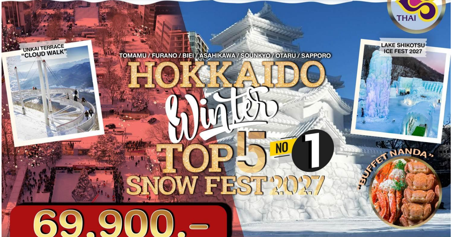
UNKAI TERRACE "CLOUD WALK"

TOMAMU / FURANO / BIEI / ASAHIKAWA / SOUNKYO / OTARU / SAPPORO