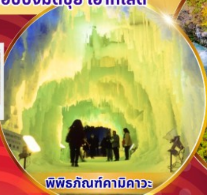
พิพิธภัณฑ์คามิคาวะ