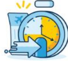
Check-in Time Limit