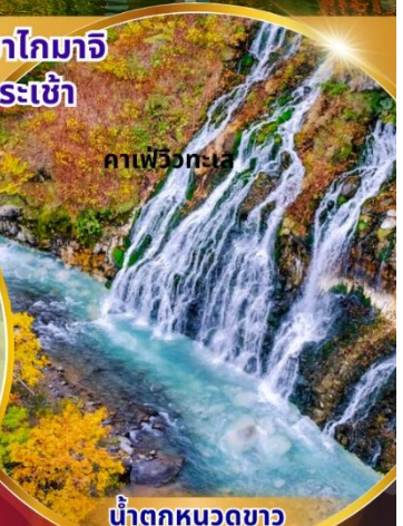
คาเฟว็องเตะ