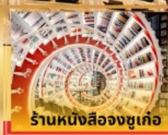
ร้านหนังสือจุงเกอ