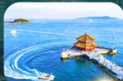
สะพานฉานเฉียว