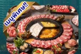
ซูฟไฟ้ชาบู

พักโรงแรม 4 ดาว ★★★★★ ฟรี ประกันอุบัติเหตุ บริการ อาหารท้องถิ่น