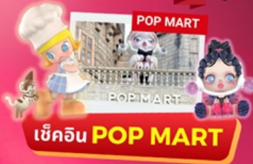
เช็คอิน POP MART