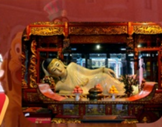
สักการะวัดพระหยกขาว