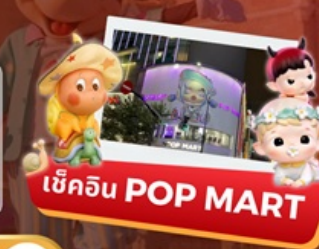
เช็คอิน POP MART