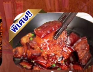
พิเศษ!! เมนูหมูสามชั้นตุ๋นน้ำแดง

พักโรงแรม 4 ดาว ★★★★★ ฟรี ประกันอุบัติเหตุ บริการ อาหารท้องถิ่น