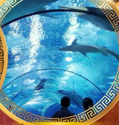
เซี่ยงไฮ้อาเซียนอะควาเรียม