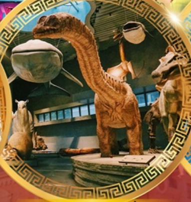
พิพิธภัณฑ์ธรรมชาติเซี่ยงไฮ้