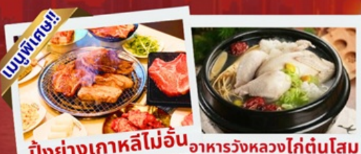
ปิ้งย่างเกาหลีไม่อื่น อาหารวังหลวงไก่ตุ๋นโสม