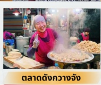
ตลาดดังกวางจ้ง