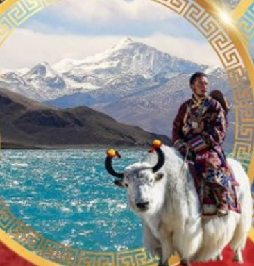
ทะเลสาบยิมดรีอก