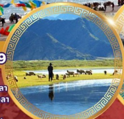
ทุ่งหญ้าทิเบตเหนือ ชางเป่ย์

ลานา พระราชวังโปตาลา วัดโจคัง ถนนแปดเหลี่ยม จุดชมวิวยิ่งเขากัมบาลา ธารน้ำแข็งคาโรลา ชิคาเซ่ ช่องเขาจาชัวลา ถนน108โค้ง เอเวอเรสต์เบสแคมป์ วัดกาซิลุนโบ ทิวทัศน์แม่น้ำหยาลู่จางปู ทุ่งหญ้าทิเบตเหนือ ช่องเขานาเคนลา ทะเลสาบนาปูซิว