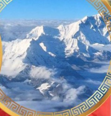
ห้าสุดยอดแห่งหิมาลัย