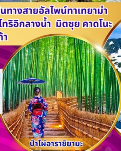
ป่าไฟอาราชิยามะ

พิเศษ! แอ้ออนเซ็น นั่งเคเบิลคาร์ ชมวิวภูเขาแอลป์