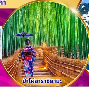
ป่าไฟ้อาราชิมะ

พิเศษ! แอ้อบเซ็น นั่งเคเบิลคาร์ ชมวิวภูเขาแอลป์