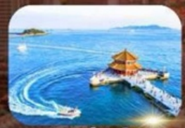
สะพานฉานเจียว