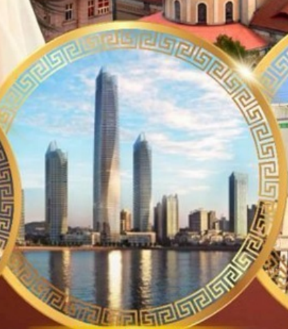
ชมวิวดาคารไฮตัน เซ็นเตอร์