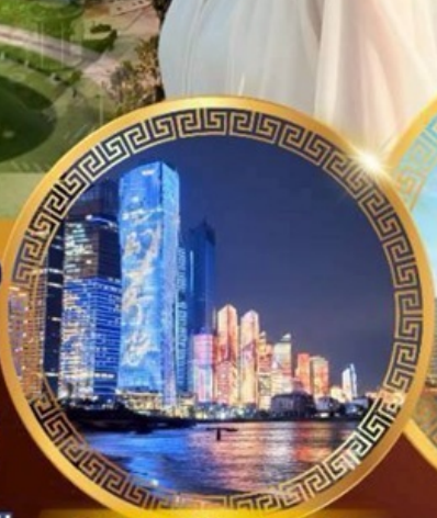
No.3 Bathing Beach

ลานจัดงานเบียร์ชิงเต่า Golden Beach ทางเดินไม้ริมทะเล ศาลเจ้าเทพทะเล ถนนคนเดินโตตง พิพิธภัณฑ์เทศบาลชิงเต่า สวนสาธารณะซิกแนลฮิลล์ ถนนหลงเจียงสู่ กระเช้าเขาไท่ผิง ยาน Da Bao Island โบสถ์ st.Michael's Cathedral ถนนจงชาน ถนนคนเดินฟิลาญย่วน จัตุรัสเบย์ไฟรี