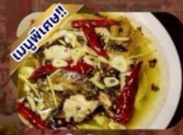
ปลาต้มพริกทอด