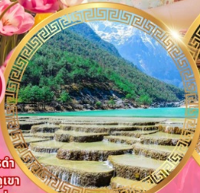
ทะเลสาบไป๋ส่วยเหอ

เมืองโบราณคู่เสียง เมืองโบราณต้าหลี่ เจดีย์สามองค์ เมืองโบราณแชนกรีล่า วัดชงจ้านหลิน ช่องแคบเสือกะโจน สระมังกรดำ เมืองโบราณลี่เจียง ภูเขาหิมะมังกรหยก ชมวิวภูเขา หิมะที่ร้าน Yun di ta ชมดอกไม้ที่สวนอุทยานชุ่ม น้ำโกวหนาน ชมดอกซากุระสวนหยวนทง