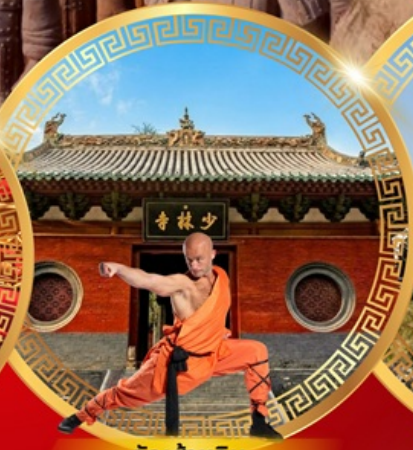
วัดเล่าหลิน