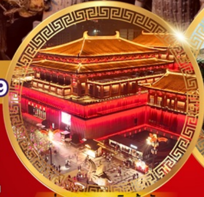
ย่านถนนคนเดินต้าถิง

วัดเล่าหลิน การแสดงโชว์กังฟู ป่าเจดีย์วัดเล่าหลิน ศาลเจ้ากวนอู ชมถ้ำผาหลงเหมิน จัตุรัสหอกลอง จัตุรัสหอรบั้ง ตลาดมุสลิม อุทยานจีนซีอองเต้ กำแพงเมืองซีอาน ชมเจดีย์ห่านป่าใหญ่ ย่านถนนคนเดินต้าถิง