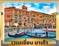
เวเนเซียน มาเก๊า