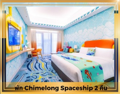
พัก Chimelong Spaceship 2 คืน