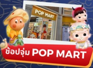
ช้อปปิ้ง POP MART