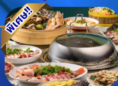
บูนไฟ้ติ่มซำ