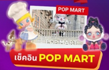
เข้คิน POP MART