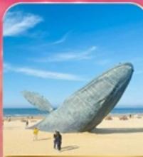
ประติมากรรม "วาฬผู้โดดเดี่ยว"