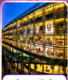
ห้างสรรพสินค้า การ์เด็นทววงหวน