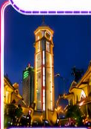
ตึกไควอิ่งไหลว