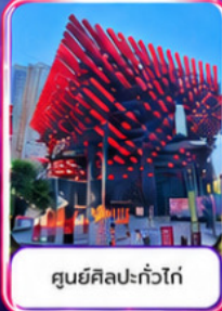
ศูนย์ศิลปะแก้วโก