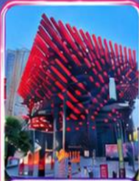
ศูนย์ศิลปะกะวู่โต๋