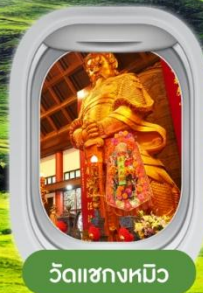
วัดชวงหมิว