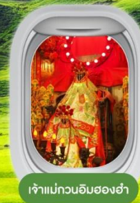
เจ้าม้ากวนอิมฮองฮ่า