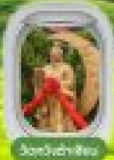
Scenic Night View