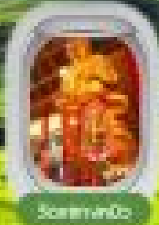
Southern Dim Sum