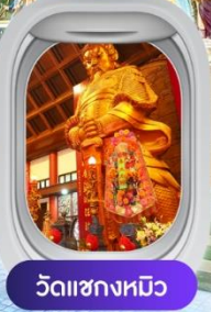
วัดฯชางหมิว