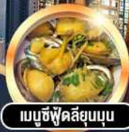
เมนูซีฟู้ดสลีสุนบน