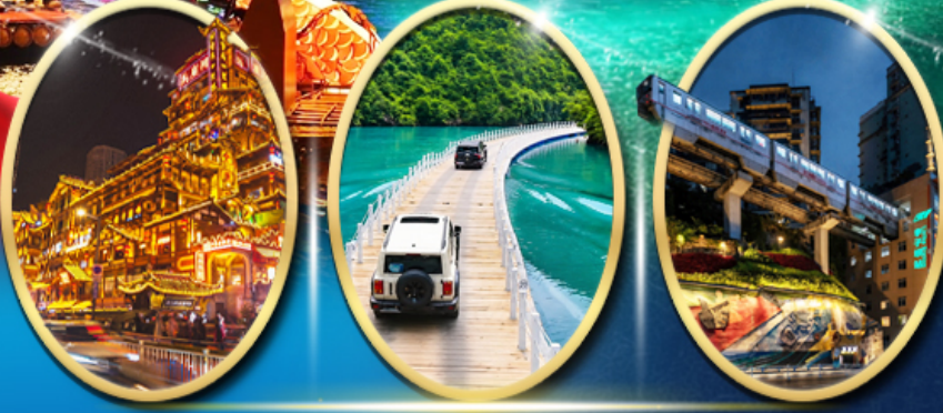
หงหยาดัง ประตูสิงโตแห่งเซวียนเอิน รถไฟฟ้าทะลุติ๊ก

ราคา เริ่มต้น 20,919 บาท รวมภาษีมูลค่าเพิ่ม 7%