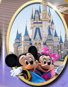
อิสระเลือกซื้อบัตร Tokyo Disneyland