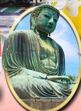
พระใหญ่คามาคุระ