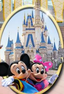
อิสระเลือกซื้อบัตร Tokyo Disneyland