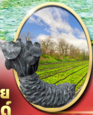
ฟาร์ม วาซาบิ ไดโอะ