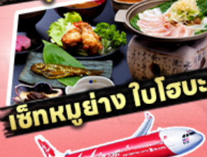
เช็กเมนูอย่าง ใบโอบะ

29,919 ราคาเริ่มต้น บาท รวมภาษีมูลค่าเพิ่ม 7%