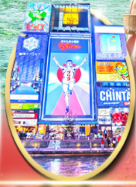
ซอปปิง ซินโซบาสึ