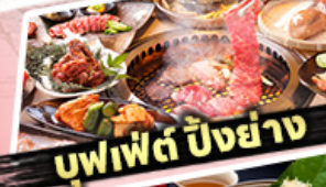
บุฟเฟต์ ปิ้งย่าง