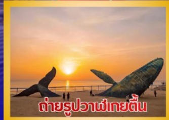
ต่ายรูปวาฬยักษ์ตื่น