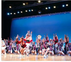
อะวะโอะโตะริไคดัง