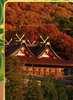
ศาลเจ้าคิฮิฮิโกะ