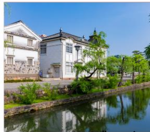
เขตอนุรักษ์เมืองเก่า คุราชิกิ