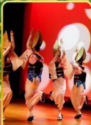
อะวะ โอะโตะริ โคคัง