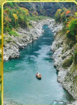
ล่องเรือช่องเขาโอโอบะ