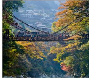
ชมสะพานคะชิระมาชิ