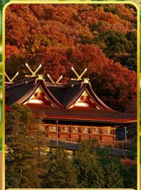
ศาลเจ้าคิมิฮิโกะ