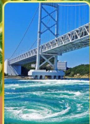
ช่องแคบนารุโตะ