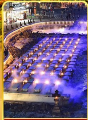
ชมยูมาทากะ