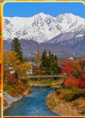
โออิเดะพาร์ค