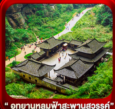
“ อุทยานหลุมฟ้าสะพานสวรรค์ ”