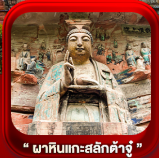
“ ผาหินแกะสลักต้าจู่ ”

บินตรงลงฉงชิ่ง • อุโมงค์ หลุมฟ้าสะพานสวรรค์ • ระเบียงแก๊ว • อุทยานเขานางฟ้า หงหยาดัง • นั้รกอไฟคะลุดัก • ศาลาประชาม (ด้านนอก) • หลงหมินฮ่าว มรดกโลกผาหินแกะสลักต้าจู่ • วัดหลิวฮั่น • ตึกตะเกียบ • หมู่บ้านโบราณสี่ซีโง่ว