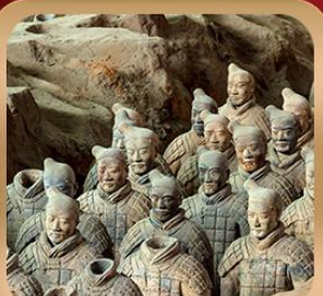
“สุสานจีนซีฮ่องเต้”