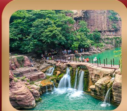
“อุทยานหยุนไต้ซาน”

ชมถ้ำหลงเหมิน มรดกโลกที่เมืองลั่วหยาง • สุสานจีนซีฮ่องเต้ • ศาลเจ้ากวนอู วัดเส้าหลิน + ป่าเจดีย์ + ชมโชว์กังฟู • เมืองโบราณลั่วอี้ • อุทยานหยุนไต้ซาน เจดีย์ห่านป่าใหญ่ • ถนนวัฒนธรรมต้าถัง • ถนนคนเดินอิสลาม • จัตุรัสหอระบิง