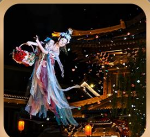
“เมืองโบราณลั่วอี้”