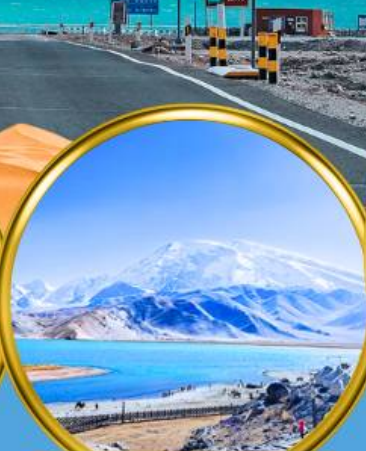
Kala Kule Lake