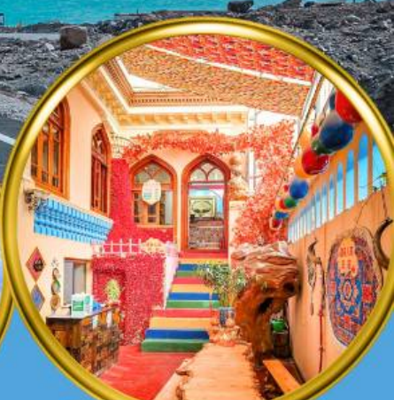
เมืองเก๋าคัชการ์