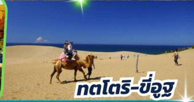
ทตโตริ-ซึอูจ