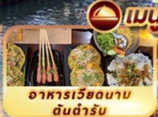
อาหารเวียดนาม ต้นตำรับ