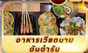
อาหารเวียดนาม ต้นตำรับ