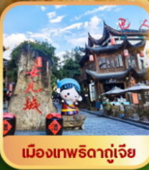
เมืองเทพริดาตุ๋เจีย