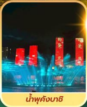
น้ำพุคังบาชิ