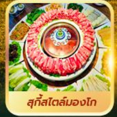
สุกีสโตล์มองโก