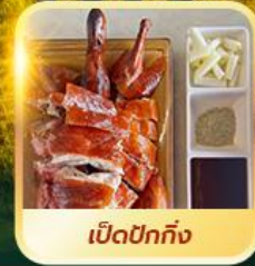
เบ็ดปักกิ้ง