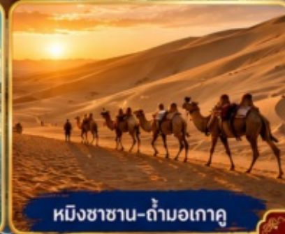
หมิงซาฮาน-ถ้ำมอเกาคุ