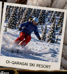
OI-QARAGAI SKI RESORT