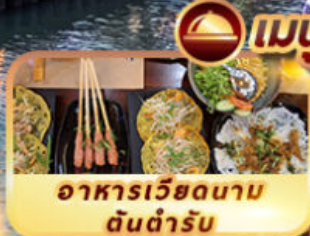
อาหารเวียดนาม ต้นตำรับ