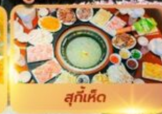
สุกั้เห็ด