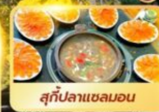
สุกี่ปลาเซลมอน