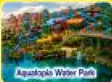
Aquapark Water Park