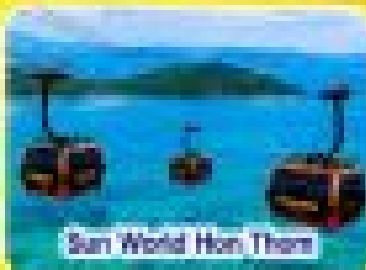
Sun World Hon Thom