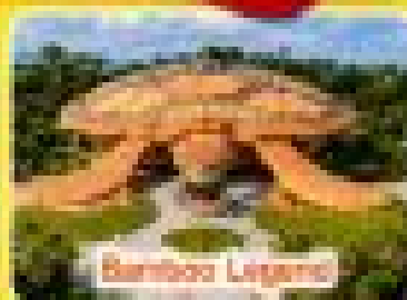
Binh Ba Legend