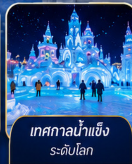
เทศกาลน้ำแข็งระดับโลก