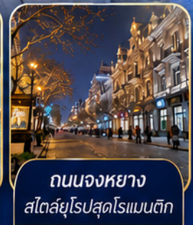
ถนนจงหยาง สไตลียูโรปสุดโรแมนติก