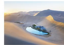
ทะเลทรายหมิงซาซาน ทะเลสาบพระจันทร์เสี้ยว

16.32 น. ออกเดินทางสู่เมืองอู๋หลู่ฟาน ด้วยรถไฟความเร็วสูง ขบวนที่ D55