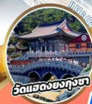
วัดแสดงยงกุงซา