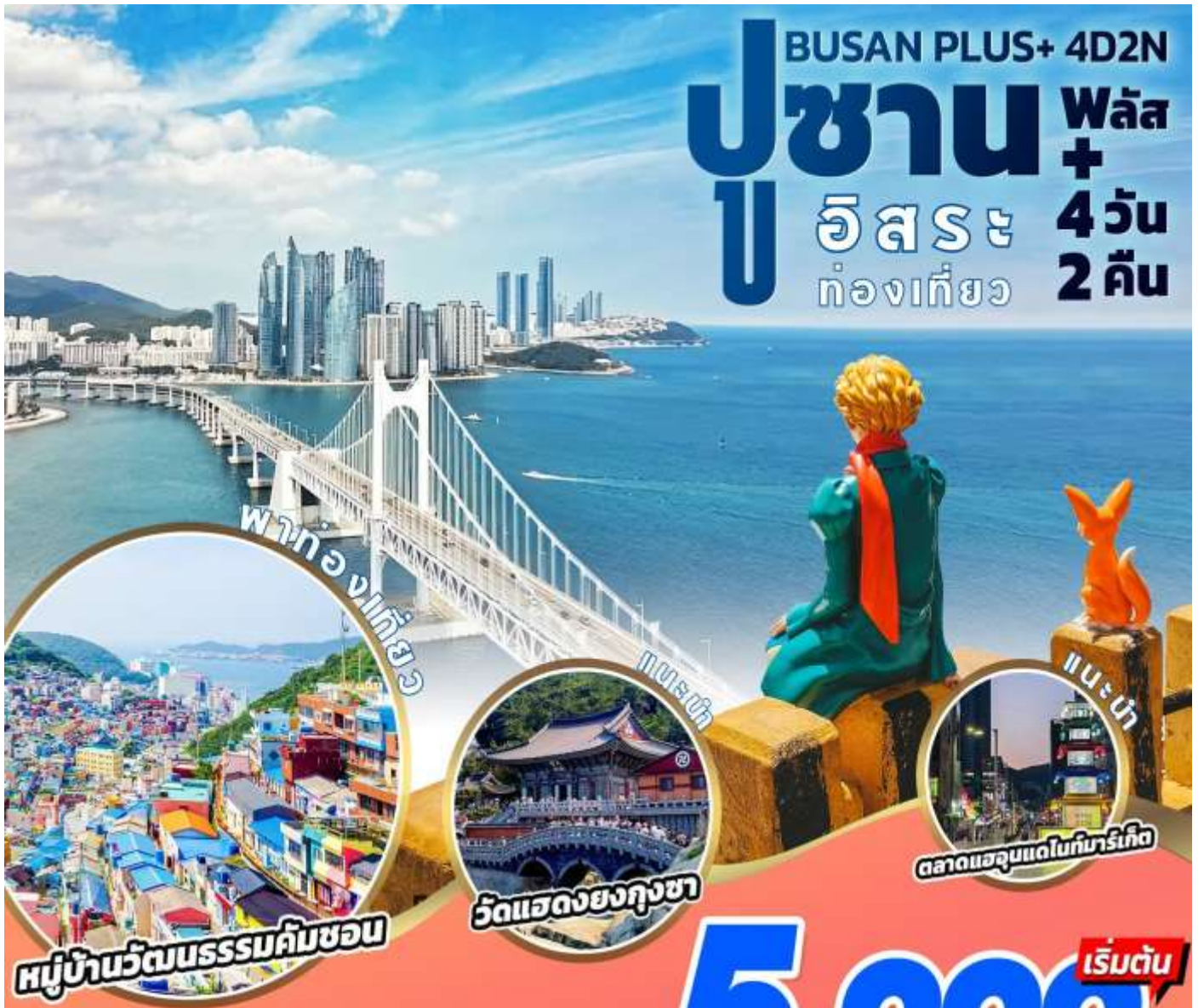
พาท่องวิวที่สวย