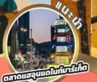
ตลาดแฮอนแดไนท์มาร์เก็ต